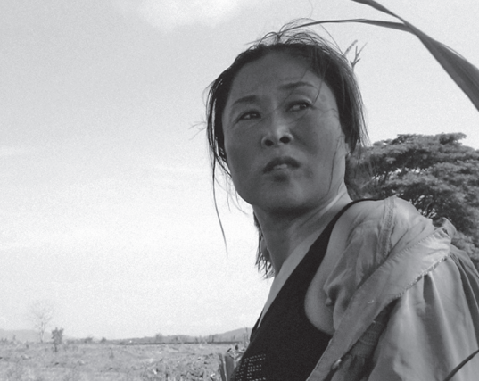
Madame B, Histoire d'une Nord-Coréenne de Jero Yun

Rafael Correa soumet à l'Assemblée Nationale un projet de loi taxant à 77,5 % les héritages fortunés. Il octroie aux femmes au foyer le droit à la retraite, défend l'éducation gratuite et la santé pour tous. Chrétien social, il fustige les effets ravageurs du capitalisme.