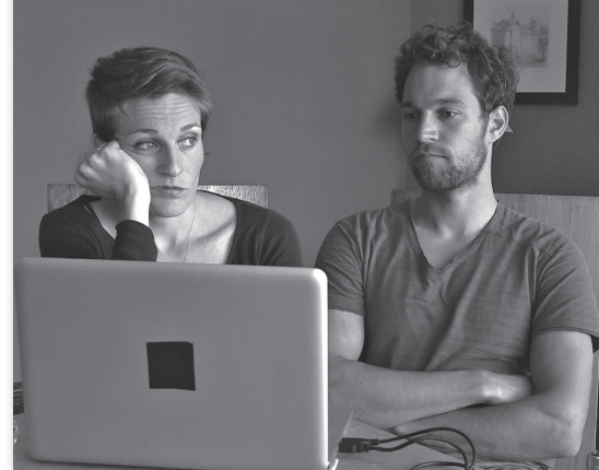
On revient de loin de Pierre Carles

Le cinéaste recherche les lieux et les personnes rencontrées par le photographe. Retour sur la création d'une esthétique du réel propre à une