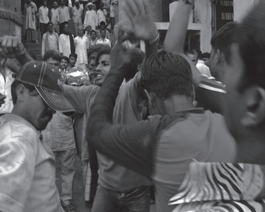
La vie est ailleurs d'Elsa Quinette