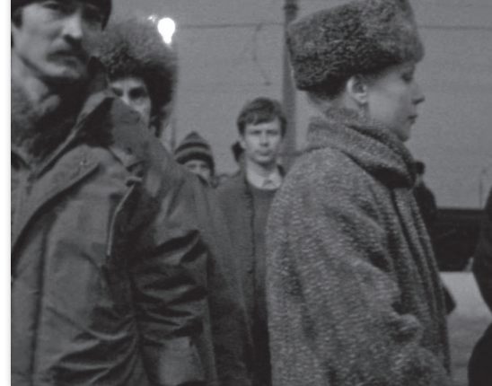
D'Est de Chantal Akerman

1993 - France, Belgique - vostf - 110' - HC - Paradise Films/Arte/Lieurac Productions/RBF/RTP JEUDI 24 NOV - PR 20H30 - SALLE G. CONCHON