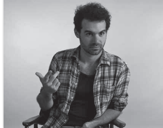
La place de l'homme - Coline Grando

2016 - France - 80' - P - Abacaris Films jour - pr heureh - salle MARDI 28 NOV - PR 14 H - SALLE B. VIAN