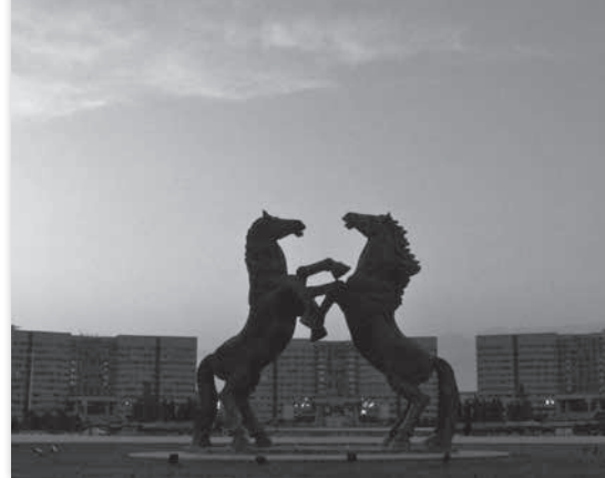
Un rêve chinois - Remi Bassaler

2017 - Colombie, Belgique - vostf - 50' - PP - Cobra films/Wapu lab MARDI 28 NOV - PR 20H30 - SALLE G. CONCHON