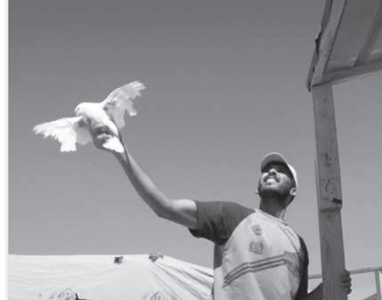
Kachach, Au-Dessus De Zaatari - Bruno Pieretti

2016 - Suisse - vostf - 41' - FA - HEAD-Genève Département Cinéma/cinéma du réel/Sayaka Mizuno MARDI 28 NOV - PR 20H30 - SALLE G. CONCHON