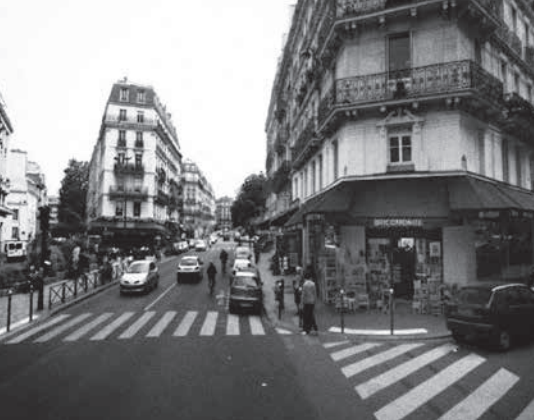
Mon père et les clous - Samuel Bigjaoui