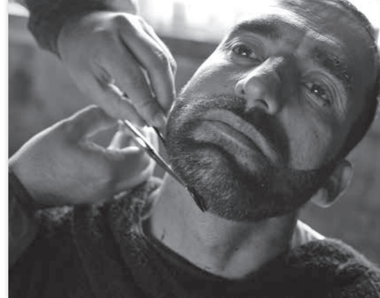
The barber shop - E. Cancet et G. Almenara