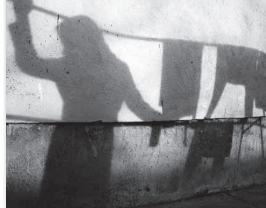
Des rêves sans étoiles - Mehrdad Oskoueï

Une étonnante communauté qui vit dans une pièce unique, grande salle dortoir. Mehrdad Oskoueï les filme dans ce huis clos avec une attention et une dignité extrêmes.