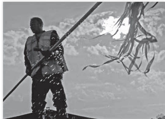
Les ramasseurs d'herbes marines - Maria Murashova

2017 - France - 29' - - E2P Entre2prises/Baldanders Film/Télé Bocal/Le Snark MERCREDI 29 NOV - PR 20 H 30 - SALLE G. CONCHON