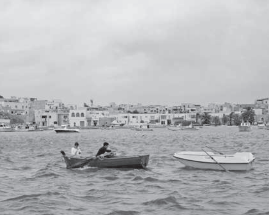
Fuocoammare - Gianfranco Rosi