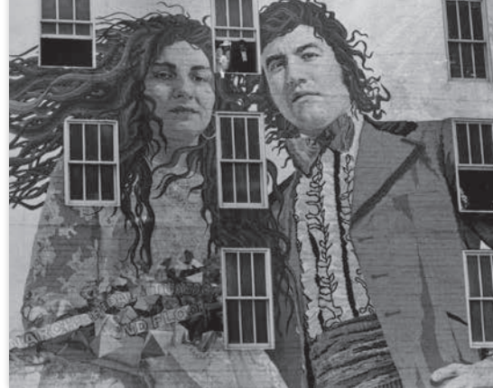
Mur murs - Agnès Varda

Une nouvelle rubrique du festival s'ouvre, qui concernera différents domaines artistiques, selon l'actualité du cinéma : cette année le théâtre, la danse et les arts textiles.