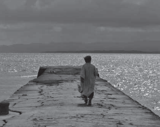
Au fil du monde Japon - J. Coulon et I. Dupuy-Chavanat

Le film mêle le théâtre, la vie, la politique. Le responsable palestinien du camp de Jénine a une parole que Shakespeare aurait pu écrire : « The murder is not my job ».